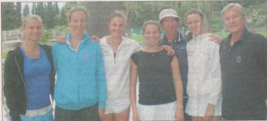
Les filles du TC Francis-Giordan Les Combes Nice accèdent en Nationale 1A.