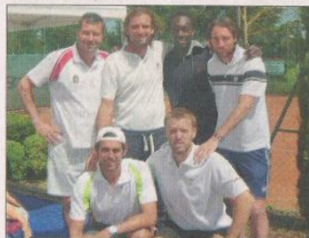
Les joueurs du Monte-Carlo Country-club (N1B).

Doubles : Balleret-Couillard battent Popp-Klier; Commin-Drouet battent