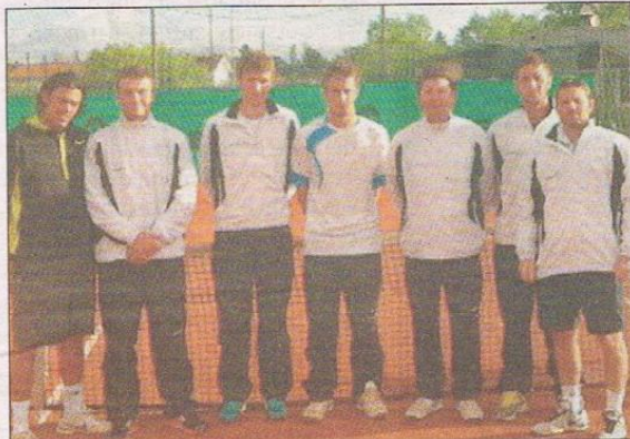
L'équipe fanion du TC Grasse, tenue en échec par Dunkerque (4-4) en N2 alors qu'elle menait 4-1.