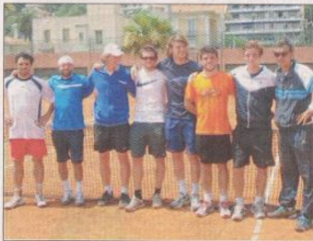
Les garçons du Nice LTC (Nationale 2).

En Nationale 1B masculine, le Monte-Carlo Country-club a assuré l'essentiel en s'imposant à Lisieux, en sans s'être fait une grosse frayeur : « On perdait 3-2 après les