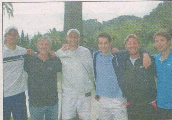
Les garçons du Tennis-club Francis-Giordan / les Combes Nice, vainqueurs à Fontainebleau.

Ce n'est pas tous les jours que l'on s'offre une perf en "promotion" !