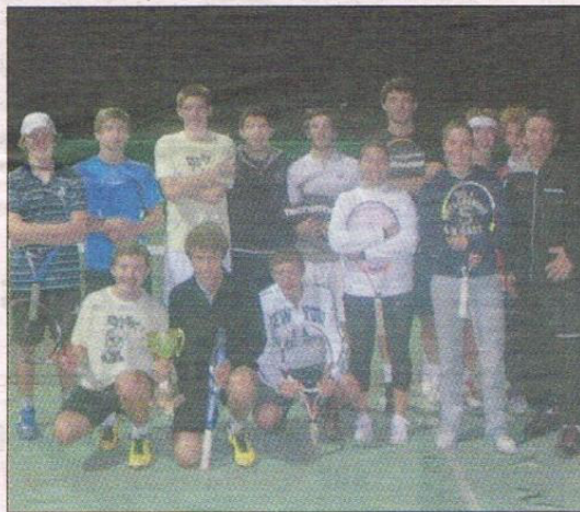
Les jeunes du TC Francis /Giordan brillent sur la scène départementale.

On suivra également le comportement des équipes jeunes et des seniors (Nationale 1B et N2, en mai 2012). Les équipes, encore une priorité pour ce sport individuel, ou les jeunes apprennent à « s'effacer » pour le club.