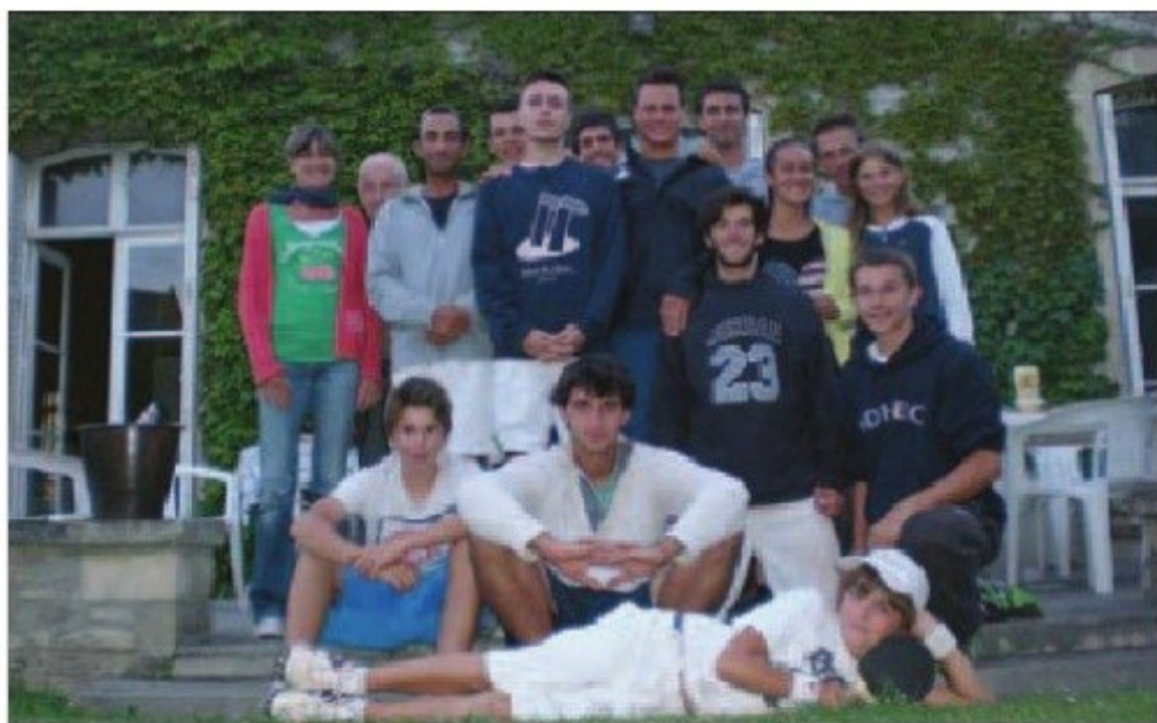
Le team Giordan/Les Combes lors de sa tournée de trois semaines sur les côtes normandes. Tranches de vie inoubliables...