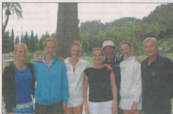
L'équipe filles du TC Giordan/Les Combes s'est imposée 8-0.

Messieurs - Nationale 1B Monte-Carlo - Lagord 3-4