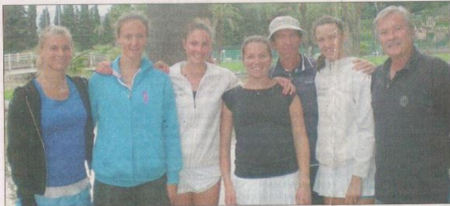
Les filles du TC Francis-Giordan Les Combes Nice accèdent en Nationale 1A.