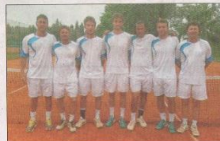
Les garçons du TC Grasse ont disputé un beau championnat en N2.