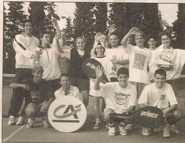
Un bilan très positif pour les jeunes du club...

L'équipe II a terminé deuxième de la Ligue Côte d'Azur, n'ayant pu correctement défendre ses