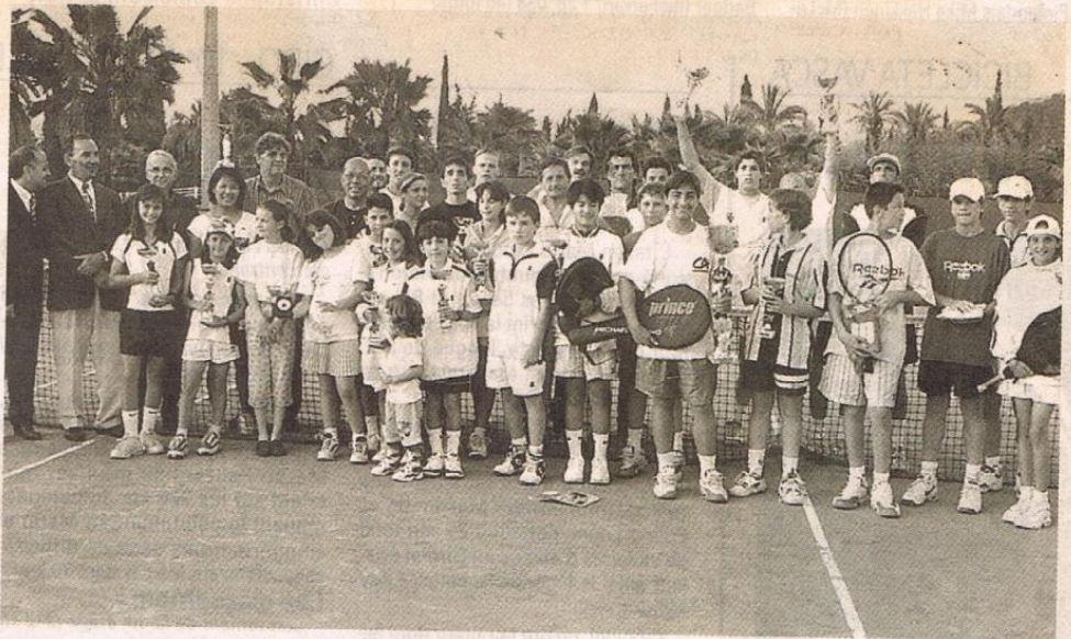
Des participants au tournoi, encadrés par les dirigeants du club