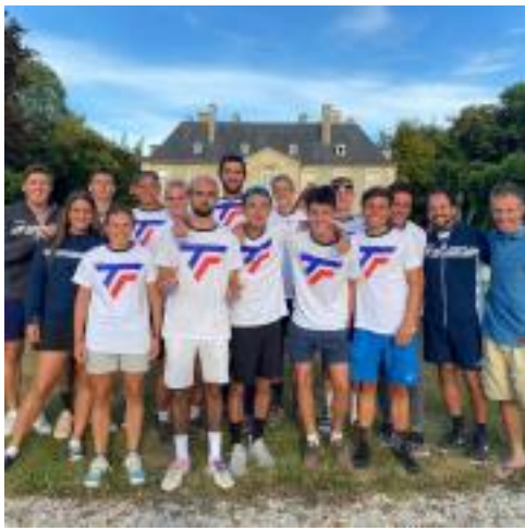
Mercredi 5 aout : Cabourg