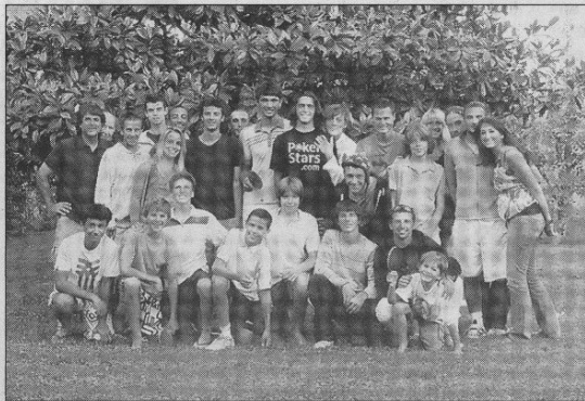
La délégation niçoise sur les prés normands.