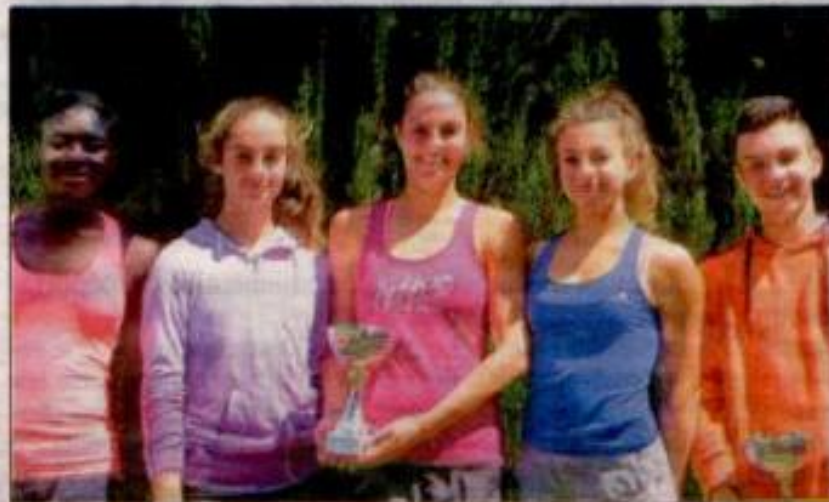
Les champions du Tennis Club Giordan.