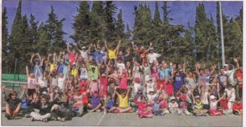
Le TC Nice Giordan récompensé.