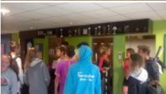
Luc sur Mer Repas