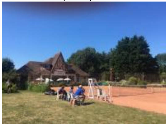
Lion sur Mer