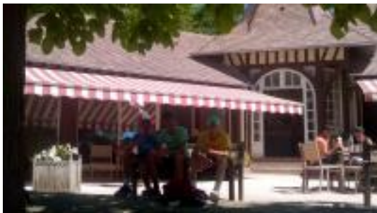
Houlgate, un club magnifique