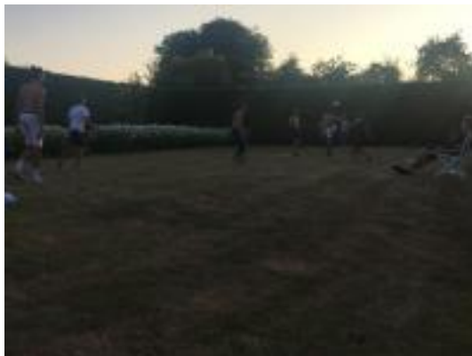
Foot au chateau