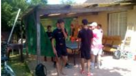
Pas belle la plage ?