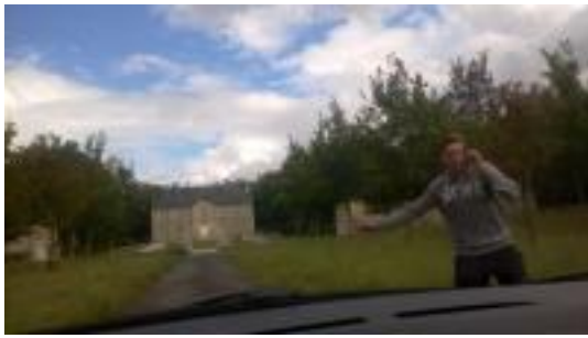
Arrivée au Château, accueil du châtelain!