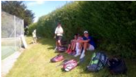
Ver sur Mer, moments cool, au soleil