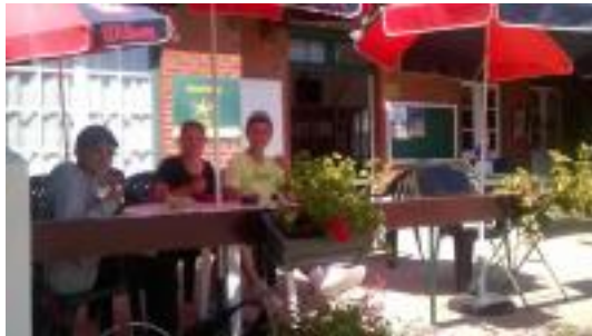
Ping Pong endiablé à Lion/Mer Riva, habité du soleil