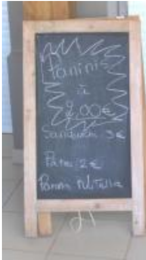
Houlgate, très sympa Toujours les pâtes à 2 € !!!