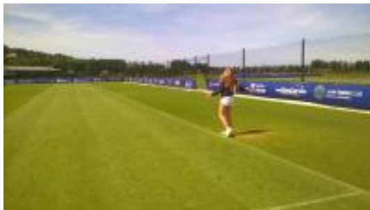
Poker sous l'énorme tête de cerf. Qui est cette star des courts sur le gazon Normand ?