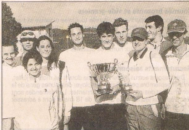
TCF Giordan-Combes : 1 er club du Sud-Est de la France avec trois équipes en National.