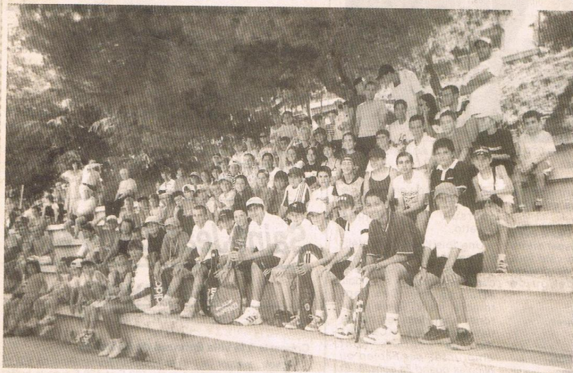
Les enfants de l'école de tennis de l'ASLN Gorbella.

Une saison 1999-2000 très animée pour le jeune club niçois qui travaille tranquillement au quotidien pour tous ses membres. En effet, les animations n'ont pas manqué tout au long de l'année avec : les minis tournois jeunes et adultes organisés lors des 24 heures du