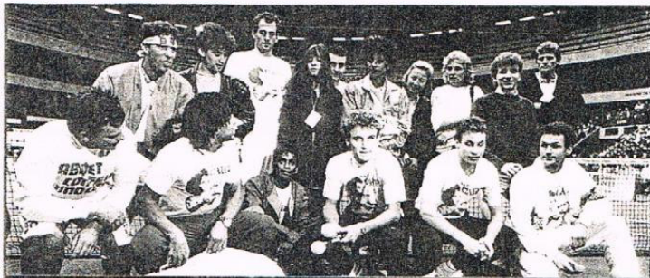
Une partie de la « troupe » qui a assuré la troisième tournée Care dans six villes de France.