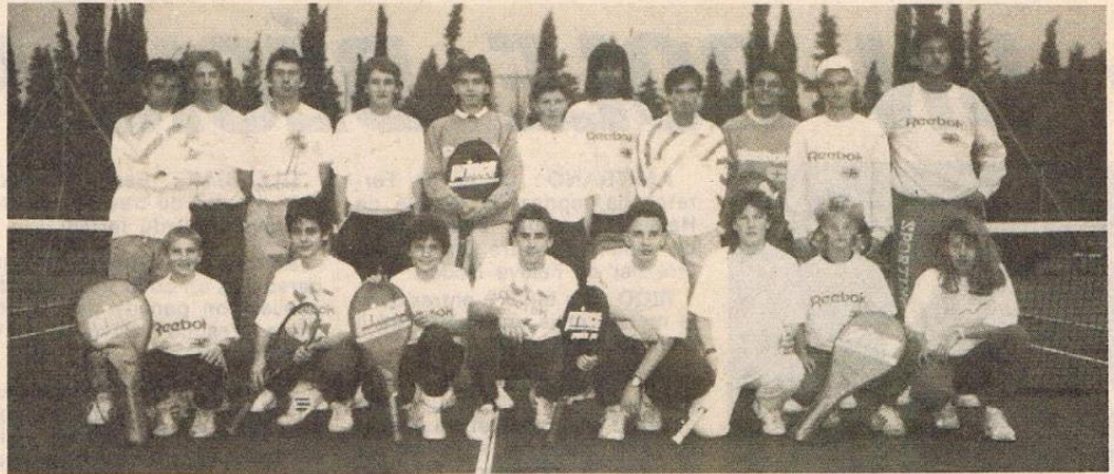
Le team de compétition et le tennis études du Cacel sur les courts des Combes.