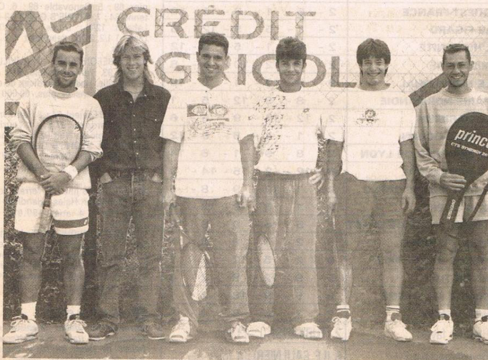
Les deuxièmes série du camp d'entraînement.

Le tour d'horizon ne serait pas complet, si on omettait le Crédit agricole, qui participe activement à cet effet pour les jeunes et le sport.