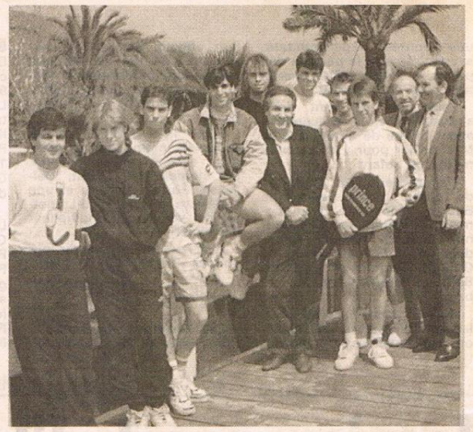
L'équipe I du T.C. Francis Giordan.