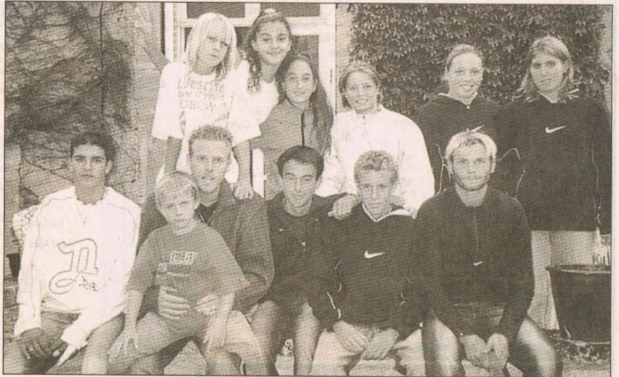
Programme chargé pour les licenciés du TCF Giordan-Combes.

La Normandie n'était pas la région la plus proche pour organiser ce genre de tournée, mais l'inconvénient du déplacement était compensé par l'organisation des tournois (les compétitions rapprochées géographiquement avaient des dates qui s'enchaînent parfaitement).