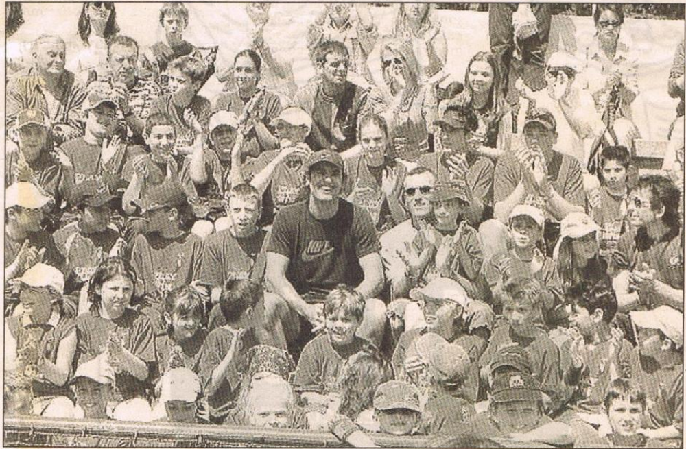
Le Tennis-Club Francis Giordan Les Combes a reçu la visite de Cédric Pioline, l'ex numéro 1 français, pour un clinic avec plus de 250 jeunes.