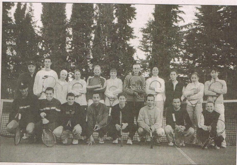
Les meilleurs jeunes du Tennis-Club Francis Giordan ont participé à un stage pendant les dernières vacances scolaires et attendent avec impatience d'échanger quelques balles avec Cédric Pioline.

En marge des championnats régionaux et nationaux, l'ancien numéro un français effectuera un « clinic » le 24 avril avec les jeunes du club et de l'extérieur