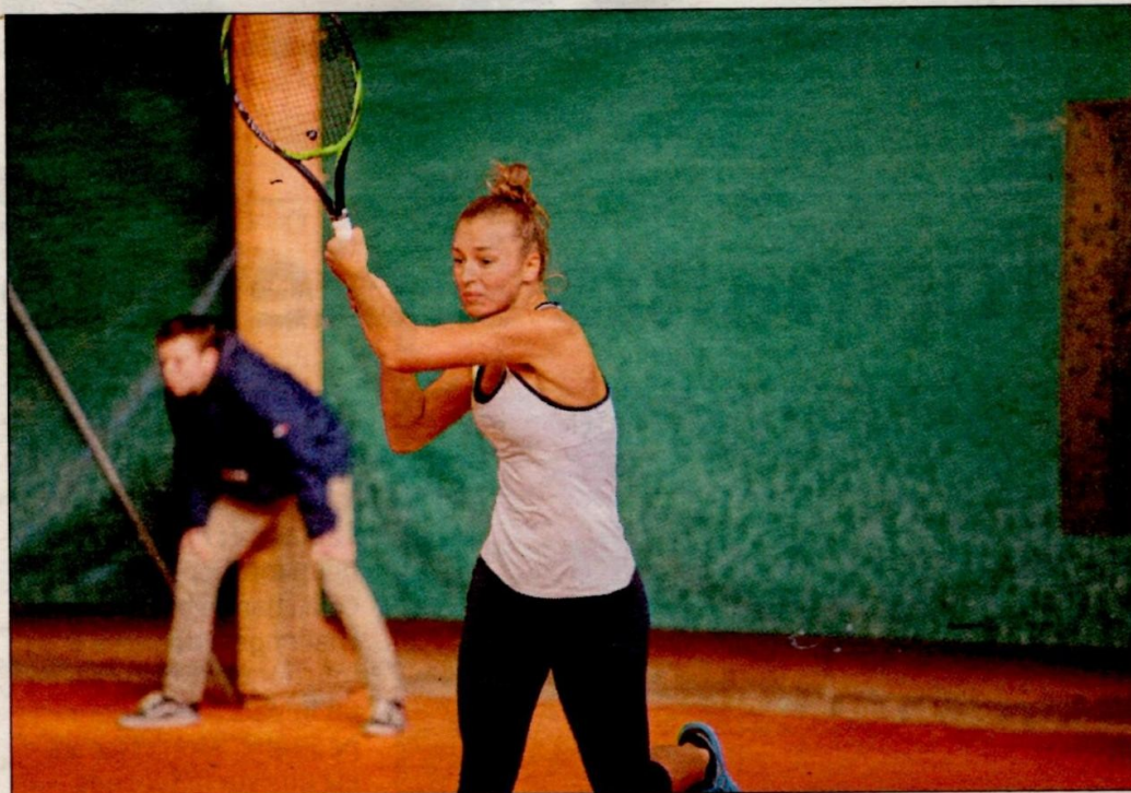
Petite déception pour les Niçoises qui rêvaient pourtant de Pro A.